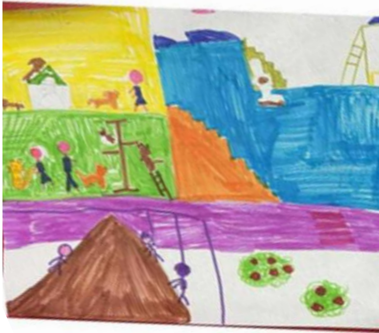
Ridurre gli sprechi è una delle richieste degli alunni agli amministratori del futuro, insieme al riciclo e al riutilizzo delle cose

La cosa più importante di tutte è l'aria pulita e un po' di silenzio, perché a volte c'è troppo rumore e fumo. Abbiamo imparato le 3 R: Dobbiamo imparare a RIDURRE gli sprechi, come l'acqua e la plastica che usiamo in classe. Se usiamo meno cose, c'è meno spazzatura! Poi, vorremmo tanto degli spazi per noi. Invece dei parcheggi pieni di macchine, noi sogniamo un grande ECO-parco dove si può